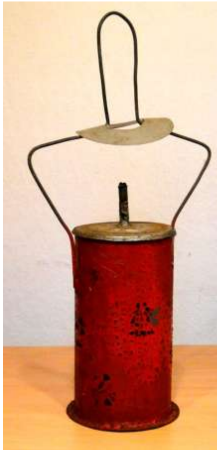
Zelfgemaakte carbidlamp geschonken aan de stichting Geheugen van Plan Zuid door dhr van Gool

Om enig licht in de huiskamer te krijgen werd van alles geprobeerd, ook een carbidlamp. Imitatie carbidlamp natuurlijk, door handige jongens geconstrueerd.